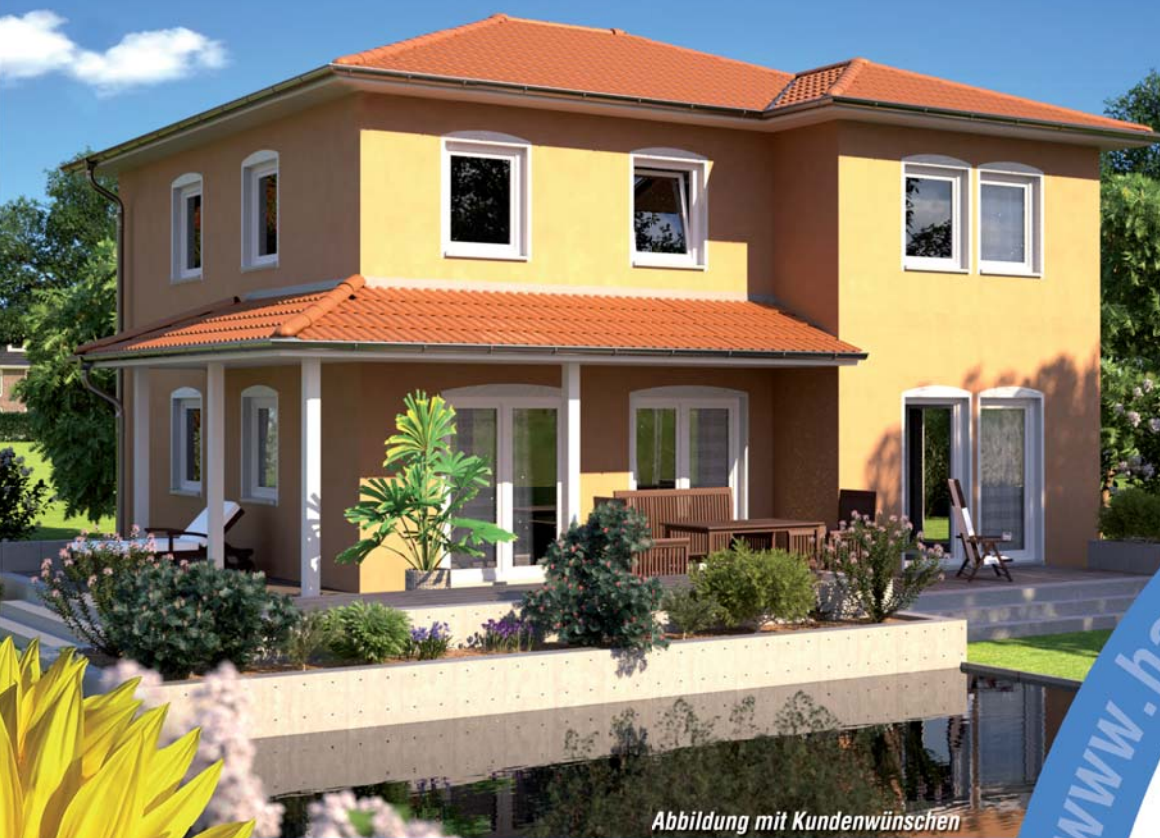
Abbildung mit Kundenwünschen