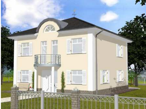
(ABB. erhalten Sonderleistungen!!!)